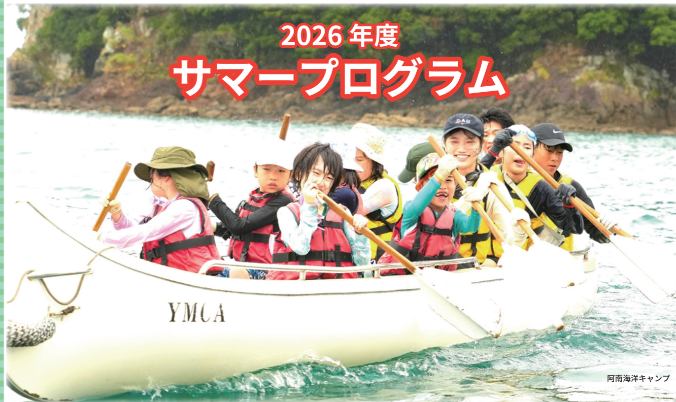
阿南海洋キャンプ